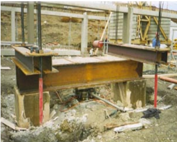
Essai de charge de 2250kN sur un pieu du Parking souterrain au Campus Scolaire Geeseknaeppchen (L)