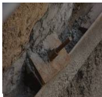
Paroi berlinoises bois / béton