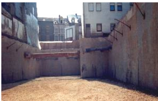
Paroi moulée à Esch-sur-Alzette (L)