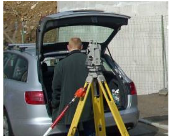
Levé topographique et plans